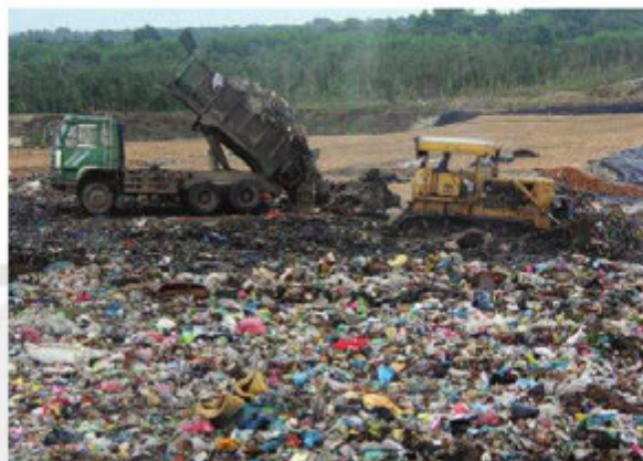
Hình 2. Bãi chôn lấp chất thải

Thông tin 2. Nhiều khu công nghiệp ở nước ta, do sử dụng công nghệ lạc hậu đã làm phát sinh nhiều chất ô nhiễm. Sự lạc hậu về công nghệ dẫn đến việc gia tăng mức độ tiêu thụ nguyên liệu và năng lượng hơn, phát sinh nhiều chất thải hơn, gây sức ép đối với môi trường. Trong khai thác khoáng sản, việc quá chú trọng đến sản lượng khai thác, chưa quan tâm nhiều đến sử dụng công nghệ đã làm gia tăng mức độ ô nhiễm và gây lãng phí tài nguyên thiên nhiên. Ô nhiễm môi trường tại một số làng nghề còn có xu hướng gia tăng, nguyên nhân chính là công nghệ sản xuất lạc hậu, lại chưa đầu tư cho hoạt động xử lí chất thải. Ô nhiễm môi trường tại các làng nghề chủ yếu là ô nhiễm bụi, khí độc, hơi kim loại, mùi và tiếng ồn, tùy thuộc vào tính chất, quy mô và sản phẩm của từng loại ngành nghề.