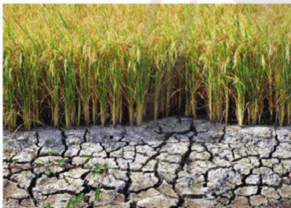
(Theo bài báo Cà Mau công bố tình hình khẩn cấp hạn hán cấp độ 2 , Báo điện tử Đảng Cộng sản Việt Nam, ngày 03/3/2020)

Em hãy quan sát hình ảnh, đọc thông tin và trả lời câu hỏi