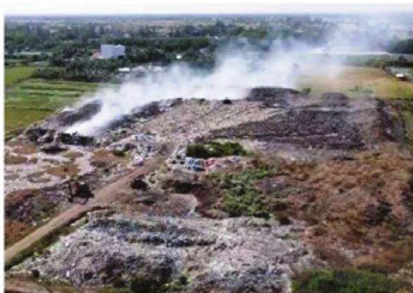
Hình 1. Đốt rác lộ thiên gây ô nhiễm môi trường (Theo Bản tin của Ban Thời sự, Đài Truyền hình Việt Nam, ngày 14/4/2021)

(Theo bài viết Việt Nam nằm trong số 20 quốc gia có lượng rác thải lớn nhất và cao hơn mức trung bình của thế giới , Tạp chí điện tử Ban Tuyên giáo Trung ương, ngày 18/10/2021)