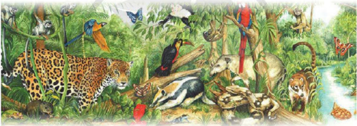
CẤP ĐỘ ĐE ĐOÀ TUYỆT CHỦNG TRÊN TRÁI ĐẤT

Thế giới đang phải đối mặt với cuộc khủng hoảng tồi tệ nhất của tình trạng tuyệt chủng và suy giảm loài, gây ảnh hưởng nghiêm trọng tới đa dạng sinh học.