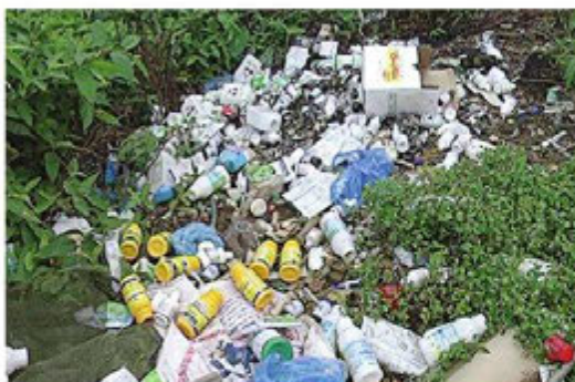
Hình 1. Vô thuốc bảo vệ thực vật do người dân vứt bỏ

Thông tin 1. Ô nhiễm môi trường từ sản xuất nông nghiệp ở Việt Nam những năm gần đây luôn ở mức báo động. Hàng chục triệu tấn chất thải chăn nuôi, chất thải trồng trọt đang ngày ngày xả ra môi trường. Bên cạnh đó, để có năng suất, môi trường đất và nước đang phải gánh chịu hàng nghìn tấn phân hoá học, thuốc trừ sâu đổ xuống mà tỉ lệ hấp thụ chỉ khoảng 40%.