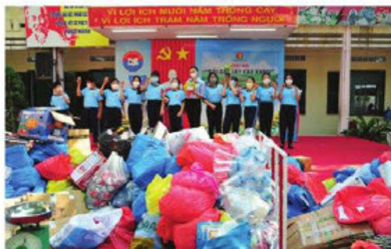
Hình 2. Học sinh tham gia ngày hội đổi rác lấy cây xanh

Thông tin. Sau hơn một năm thực hiện phong trào hạn chế rác thải nhựa, Bộ Tài nguyên và Môi trường đã tổ chức Hội nghị đánh giá kết quả thực hiện Phong trào chống rác thải nhựa. Báo cáo cho thấy, nhận thức của người dân, cộng đồng và doanh nghiệp đã được nâng cao hơn rất nhiều, bước đầu đã có giải pháp, sản phẩm thay thế cho túi ni-lông khó phân huỷ và nhựa sử dụng một lần. Các doanh nghiệp đã hưởng ứng chống rác thải nhựa bằng những hành động cụ thể, từ đó giảm thiểu được hàng tấn ni-lông ra môi trường. Người tiêu dùng dần thay thế túi ni-lông bằng gói hàng bằng lá chuối, lá sen trong sinh hoạt hằng ngày. Đặc biệt, cấp uỷ, chính quyền địa phương đã vào cuộc quyết liệt, ban hành nhiều kế hoạch phòng chống rác thải nhựa, triển khai đến cấp cơ sở, góp phần chung tay giảm thiểu rác thải nhựa, bảo vệ môi trường.