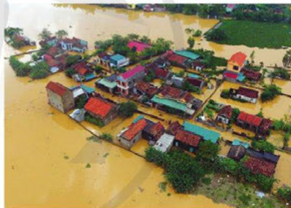
(Theo bài báo Tập trung khắc phục hậu quả mưa lũ tại các tỉnh miền Trung , Báo điện tử Hải quân Việt Nam, ngày 17/10/2016)

Thông tin 1. Trên khắp thế giới, hằng năm, hơn 90% người dân phải tiếp xúc với nồng độ những hạt bụi mịn ngoài trời cao hơn các chỉ tiêu về chất lượng không khí WHO đưa ra. Ô nhiễm không khí có liên quan tới khoảng 7 triệu ca tử vong sớm mỗi năm. Ở Việt Nam, với sự phát triển của một số lĩnh vực như công nghiệp, vận tải, tình trạng ô nhiễm không khí ngày càng nghiêm trọng và số người tử vong sớm có liên quan tới ô nhiễm không khí ngày càng gia tăng. Chính những nguyên nhân trên đã ảnh hưởng trực tiếp và gián tiếp đến chất lượng cuộc sống (sức khỏe, giáo dục, y tế,...), gây thiệt hại về kinh tế và bất ổn xã hội. Cụ thể: