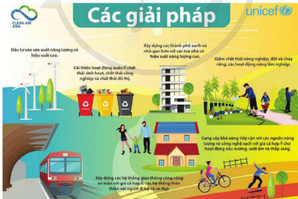
Hình 1. Các giải pháp khắc phục ô nhiễm môi trường (Theo UNICEF Việt Nam, unicef.org/vietnam , ngày 09/5/2019)

Em hãy quan sát hình ảnh, đọc thông tin và trả lời câu hỏi