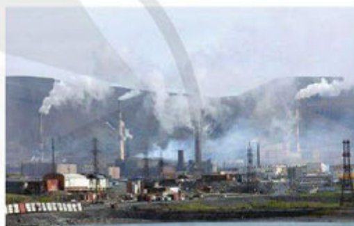
Hình 2. Nguy cơ ô nhiễm môi trường từ các khu công nghiệp

Thông tin 2. Tính đến cuối năm 2020, trên phạm vi cả nước có 369 khu công nghiệp được thành lập với tổng diện tích khoảng 114 nghìn héc-ta. Nhiều dự án, cơ sở hiện đang đầu tư, vận hành tại các khu công nghiệp gây ô nhiễm môi trường nghiêm trọng như: luyện kim, khai thác khoáng sản, phá dỡ tàu biển, sản xuất giấy, bột giấy, dệt nhuộm, lọc hoá dầu, nhiệt điện, sản xuất 698 cụm công nghiệp đi vào hoạt động.