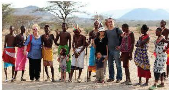
Du khách và các thổ dân Sam-bu-ru Ke-ni-a (Samburu Kenya) (2013)

Cung cấp thông tin xuất bản, phát hành và hình ảnh minh họa bổ sung.