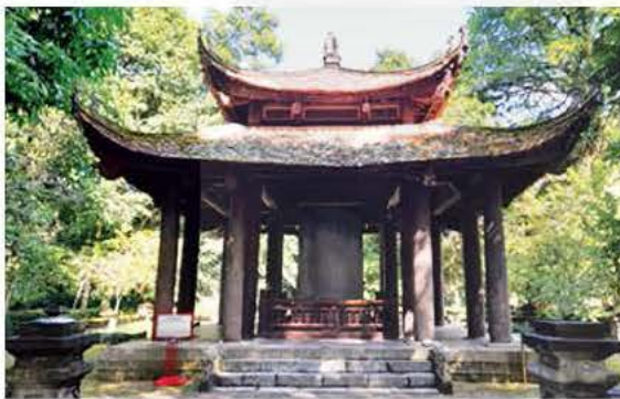
Nhà bia Vĩnh Lăng

Năm 1960 – 1961, nhà bia được nhà nước đầu tư tôn tạo lại. Nền nhà hình vuông, có cạnh là 8,8 m. Nhà bia hai tầng mái cong, lợp ngói mũi hài, dưới được đỡ bằng 16 cột, mỗi góc 4 cột theo kiểu kiến trúc thời Lê trung hưng.